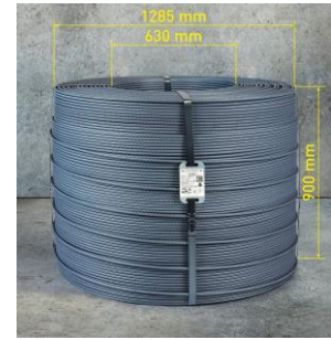
GIGA COIL 5t