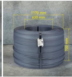
MEGA COIL 3t