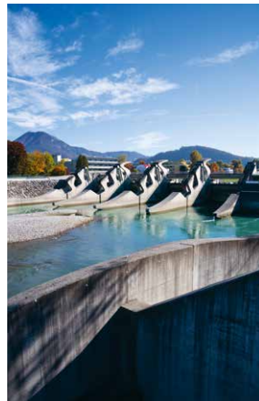
Triple Tower Wien und Wasserkraftwerk Sohlistufe Salzburg